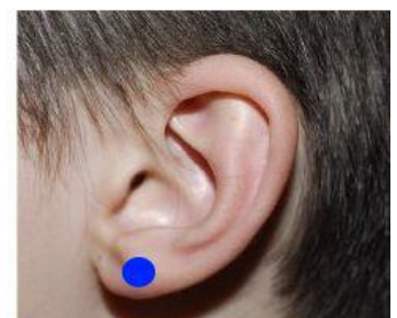
Point 4 - Earlobe