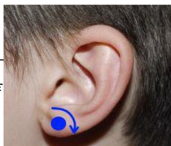
Point 3 - Behind Earlobe

Το παρόν έχει καθαρά ενημερωτικό χαρακτήρα και δε φαρμακευτική αγωγή, τη συνεχίζουν κανονικά.